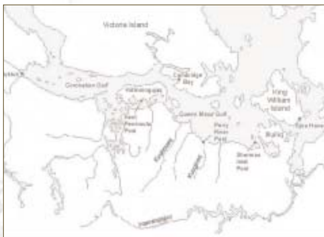
▲ Kitikmeot Region (west portion)