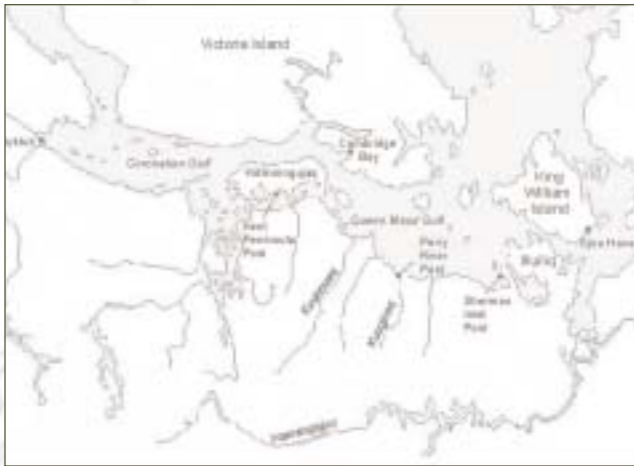
▲ La région de Kitikmeot (zone ouest)