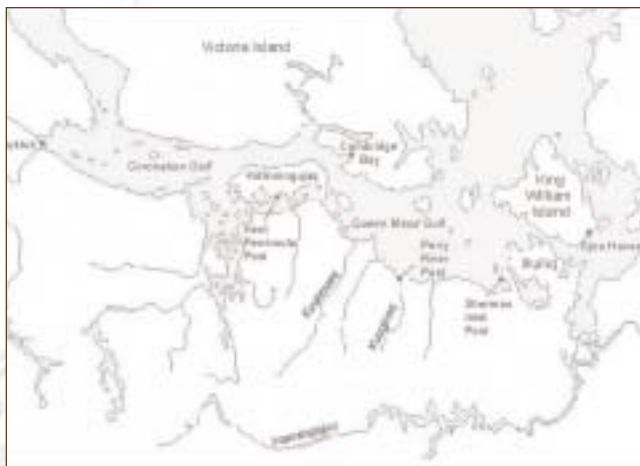
▲ Avikuhimayuk Qitirmiut (ualinia)